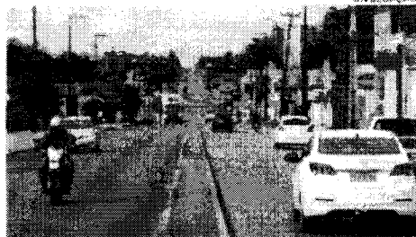
Avenida São Luís Rei de França, localizada no Turu, que segue sendo o bairro da capital maranhense com o maior número de casos de Covid-19, posição ocupada desde o mês de julho