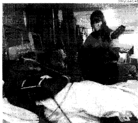
Musicoterapia visa melhorar a qualidade de vida emocional e física dos pacientes da rede municipal