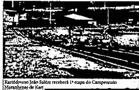
Kartódromo João Salém receberá 1ª etapa do Campeonato Maranhense de Kart

Neste sábado (14), no Kartódromo João Salém, no Complexo Castelão, será realizada a 1ª etapa do Campeonato Maranhense de Kart, a partir das 13h. O campeonato será disputado em 8 etapas ao longo do ano, sendo uma por mês, onde as categorias serão divididas em: Motores 2T (Cadete, Novatos e Graduados) e Motores F4 (Novatos, Graduados e Sênior).