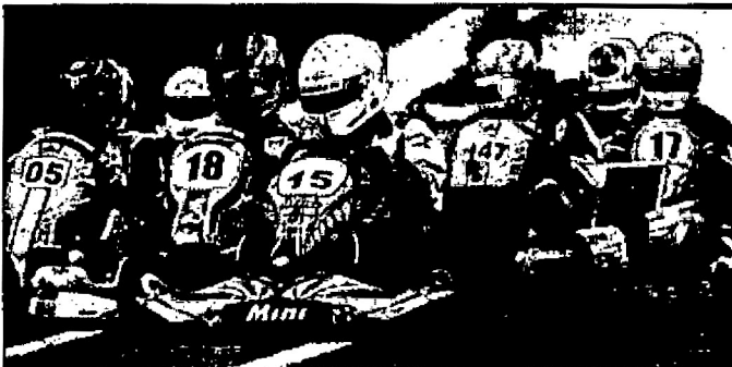
Pilotos aceleraram forte na 5ª etapa do Maranhense de Kart