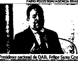
Presidente nacional da OAB, Felipe Santa Cruz

"Não há espaço para que se fale em retrocesso autoritário. O fortalecimento das instituições é a prova irrefutável de que o Brasil é, hoje, uma democracia forte e que exige respeito", concluiu.