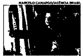
Presidente do Senado e do Congresso Nacional, Davi Alcolumbre

O presidente do Senado e do Congresso Nacional, Davi Alcolumbre, contestou, em nota à imprensa, a insinuação feita pelo deputado federal Eduardo Bolsonaro propondo um "novo AI-5", e assim, o fechamento do Congresso Nacional. "Como presidente do Congresso Nacional da República Federativa do Brasil, honro a Constituição Federal do meu país, à qual prestei juramento, e ciente da minha responsabilidade, trabalho diariamente pelo fortalecimento das instituições, convicto de que o respeito e a harmonia entre os poderes é o alicerce da democracia, que é insuscetível sob o ponto de vista civilizatório", afirmou Alcolumbre, na nota.