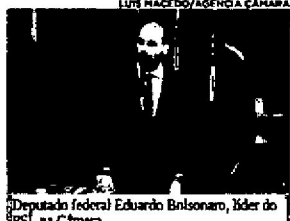
Deputado federal Eduardo Bolsonaro, líder do PSL na Câmara

Em entrevista concedida na última segunda-feira e divulgada nessa quinta-feira (31), no canal do YouTube da jornalista Leda Nagle, o deputado federal Eduardo Bolsonaro, líder do PSL na Câmara dos Deputados, afirmou que, se a esquerda "radicalizar" no Brasil, uma das respostas do governo poderá ser "via um novo AI-5".